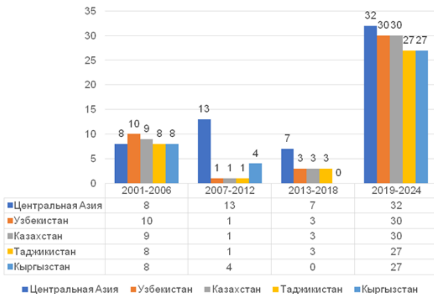
1. Динамика упоминаний слов "Центральная Азия и пять центральноазиатских стран" в декларациях ШОС по годам