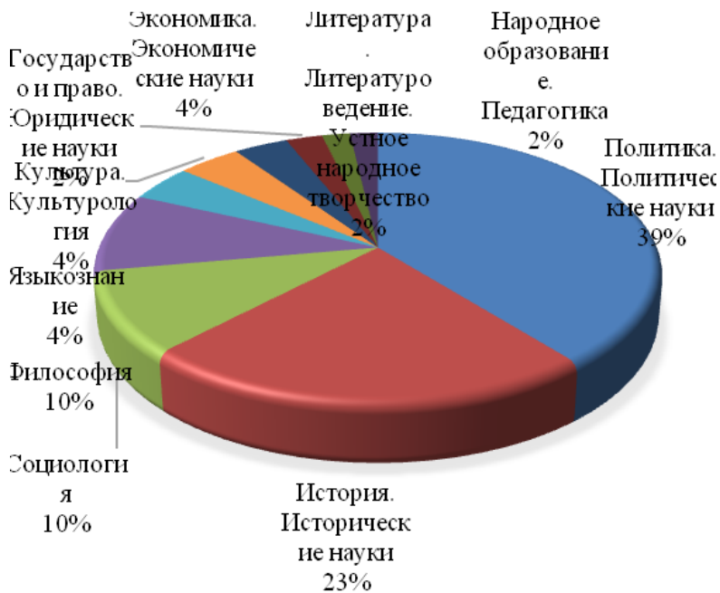
РИСУНОК 3. РАСПРЕДЕЛЕНИЕ ПУБЛИКАЦИЙ ПО ТЕМАТИЧЕСКИМ РУБРИКАМ

политологических исследований в развитии проблематики символической политики. На втором месте – «История. Исторические науки», еще раз подчеркивая тесную связь этой сферы знаний с вопросами «коллективной памяти» и «переосмысления прошлого», характерными для анализируемой предметной области.